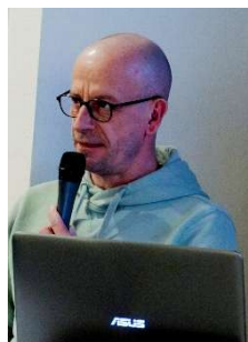
Comité des fêtes