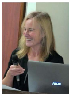
Run et Partage