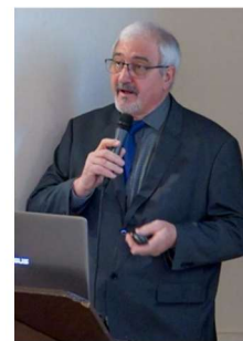
Amicale Laïque Les Balsamines Les Charitables